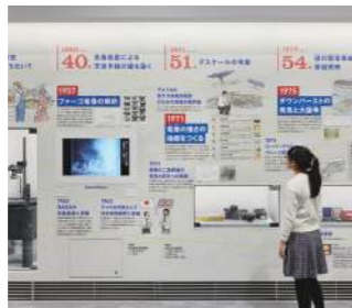
미스터 토네이도 후지타 테쓰야 박사