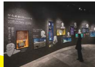
영감을 얻는 창문